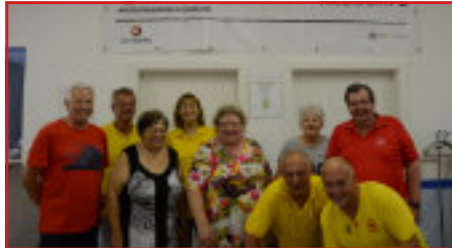
Das Team des Vorstands des PVÖ Ortsgruppe Neudörfel

zur „Nordkroatischen Inselwelt“, in das Uhdlerland, zur 100 Jahre Burgenland Ausstellung auf die Friedens-