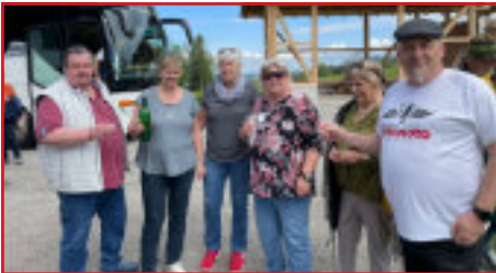
Eine Stärkung bei den Ausflügen darf nicht fehlen

Ob Sport- und Spieltag in Ritzig oder Landeswandertag: Überall waren Mitglieder des Pensionistenverbandes Neudörfel vertreten. Jährlich stehen auch Kulturausflüge nach Mörbisch und nach Kobersdorf am Programm.