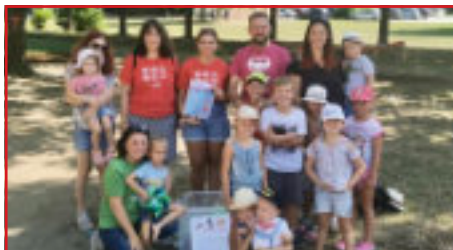
Übergabe der Spielzeugkiste am Spielplatz in Neudörfli

Im Juli fand eine Spielzeugkistenübergabe auf dem renovierten Spielplatz in Neudörfli statt. Die Spielzeugkiste wurde von der Landesorganisation der Kinderfreunde Burgenland spendiert und mit Spielsachen versorgt. Die Spielsachen stehen den Besuchern des Spielplatzes zur freien Verfügung. Damit wir jedoch alle länger etwas davon haben, wird darum gebeten die Spielsachen nach dem Spielen auch wieder in die Kiste