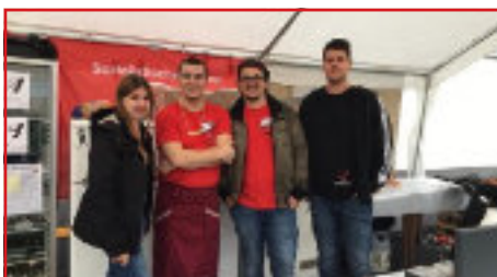
Das Organisationsteam vom Dorfpest

Als SJ haben wir in den letzten Jahren zahlreiche Veranstaltungen durchgeführt und haben auch versucht, als Sprachrohr der Jugend in Neudörfl zu fungieren. Zu