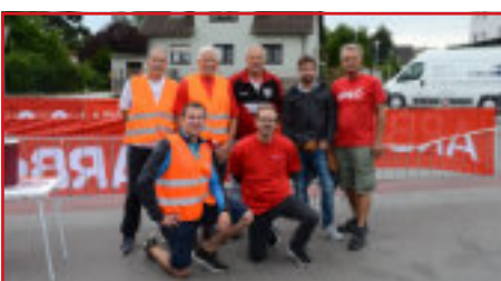
Das Team des ARBÖ im Einsatz

Er fuhr nach vier Stunden und neun Minuten als Erster über die Ziellinie. Nicht einmal zwei