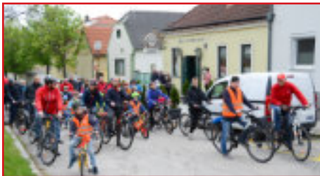
Start beim Gasthaus Gerencser

Nach einem fantastischen Fackelzug am Vortag trafen sich