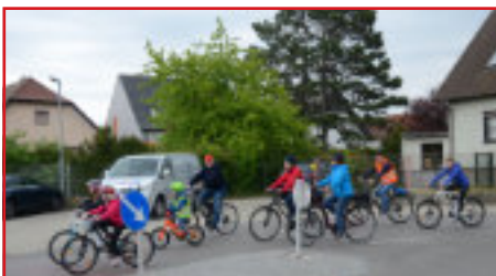
Flotte Radfahrer*innen unterwegs

bei allen TeilnehmerInnen, HelferInnen und den PolizistInnen der Polizeiinspektion Neudörfli, die in gewohnter Manier für einen sicheren Ablauf auf der Straße sorgten. Wir freuen uns schon auf nächstes Jahr!