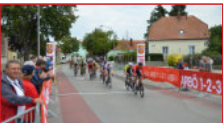
Messung der Sprintwertung

Die besten Fahrer aus ganz Österreich und aus dem umliegenden Ausland sind jährlich dabei - und das bereits zum 60. Mal.